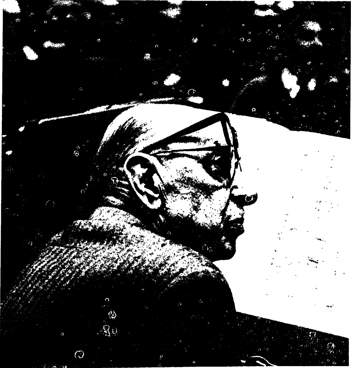
سترافسكي في فترة استراحة أثناء قيادته للاركانسيرا في أحد مؤلفاته .